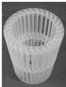
写真 1 TSR-821

一方、vantico 社(現在は Huntsman Advanced Materials 社)は PP ライクな靱性樹脂の SL-7540 を発表した。これらの内、SL-7540 樹脂はかなり評判となった。しかし、SL-7540 の曲げ弾性率は 1.1~1.4GPa であり薄板などでは形状保持に若干不安があった。その後、帝人製機(帝人製機の光造形ビジネスが NTT データシーメット社と統合したため、その後はシーメット社)は、これら先行の樹脂の欠点をカバーするエポキシ系の靱性樹脂 TSR-821 (写真 1)を 2001 年に上市した。この