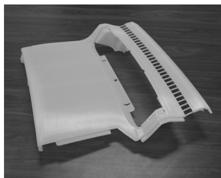
写真 2 TSR-825

2.2GPa を有し、ABS と全く同等で、ABS の感触で使えるものとなっている。